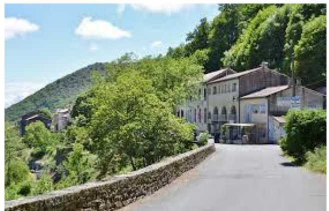
Ferrals Les Montagnes

Epousant les derniers contreforts du Massif Central, les Monts & Lacs en Haut-Languedoc offrent des paysages singuliers, très différents. Le vert des forêts, le bleu des lacs, le mauve des bruyères en fleur, un régal pictural ! Au cœur du Parc Naturel Régional du Haut-Languedoc, à cheval entre l'Hérault et le Tarn, des espaces protégés tels les tourbières et les landes s'offrent à nous. Au cœur de ce territoire, la ligne de partage des eaux forme une médiane, d'un côté de laquelle les eaux de pluie basculent vers l'Atlantique, de l'autre vers la Méditerranée.