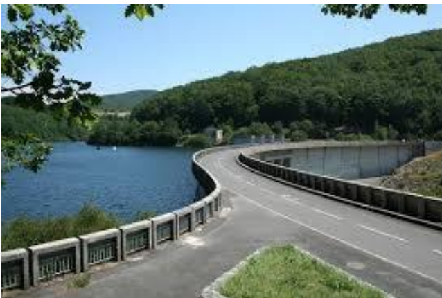
Lac de Laouzas

Le matin, nous nous retrouverons autour d'un café/croissant et nous poursuivrons par une jolie balade à travers la Montagne Noire et le Haut Languedoc, pour finir dans le Lacaunais